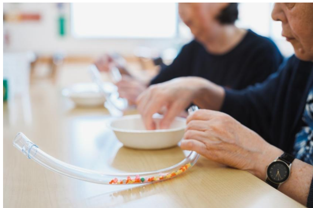
利用者様の作業の様子