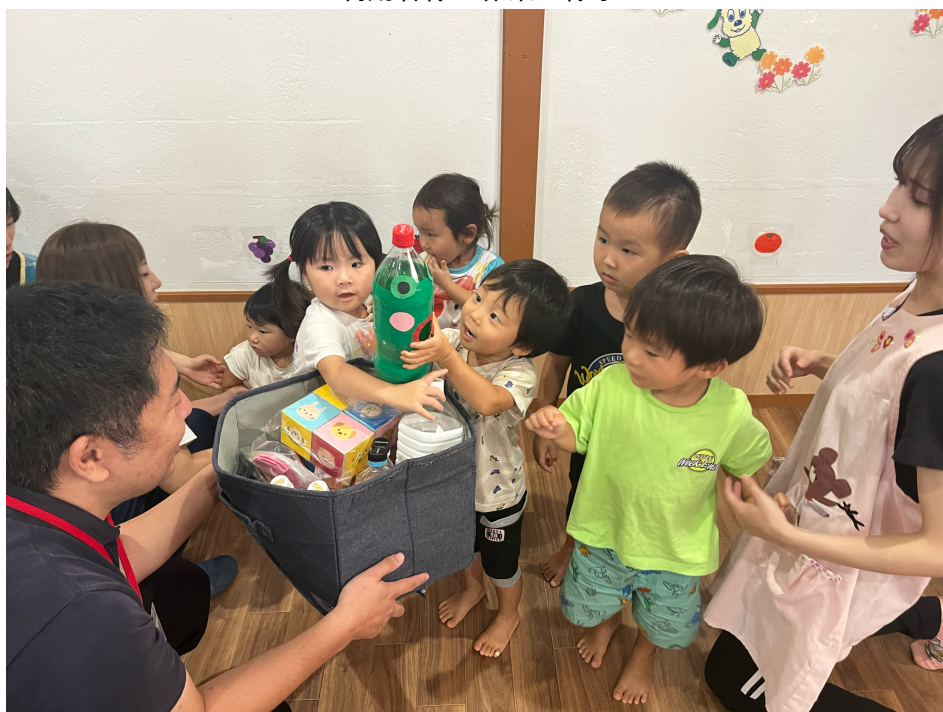
利用者様が作ったおもちゃを手にする園児たち